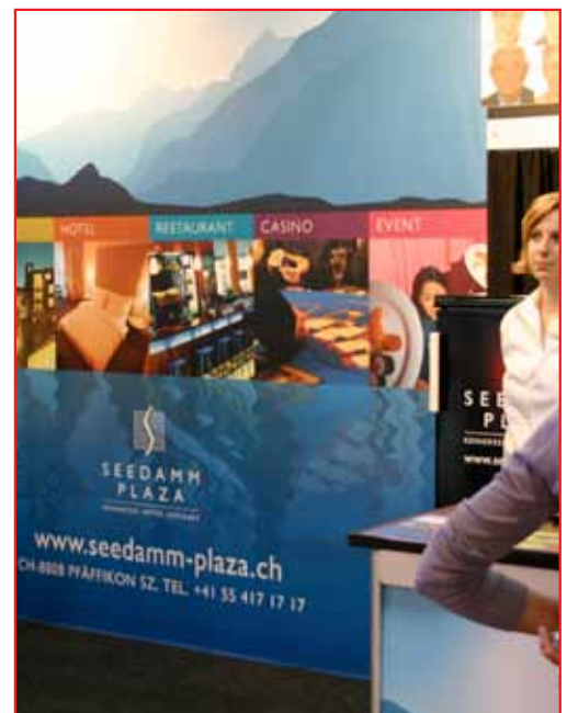
Bild: Wenn ein Besucher vor dem Display steht, sind wesentliche Informationen nicht mehr sichtbar!

„Die 60 cm Zone mitten im oberen Teil des Displays ist die optimale Zone für Text“, sagt Adam Brodsley, Leiter der Volume Inc., eine Design-Firma in San Francisco, USA. „Es ist die eigentlich einzige Zone, die vom Besucher mitten in einer Menschenmenge optimal gelesen werden kann“. Wenn Sie nicht den ganzen Text in diese Zone bekommen, bleiben Sie zumindest auf Augenhöhe. Dies wäre auf einer Höhe von ca. 1.5 Metern.