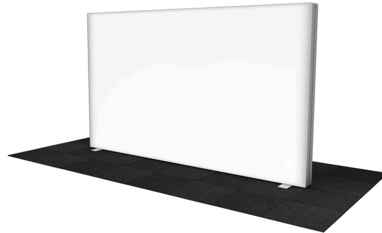
GO 300x200 cm