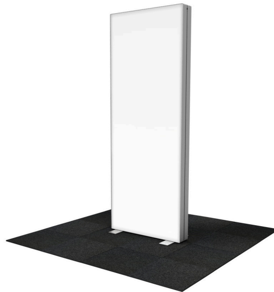
GO 85x250 cm