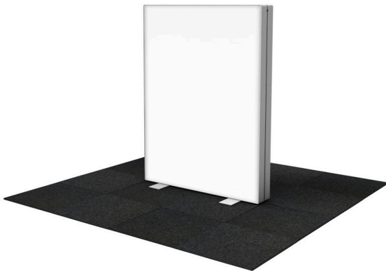
GO 100x150 cm