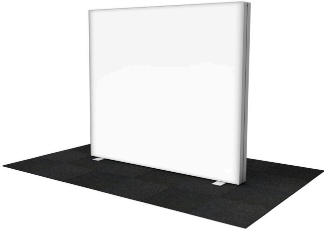
GO 200x200 cm