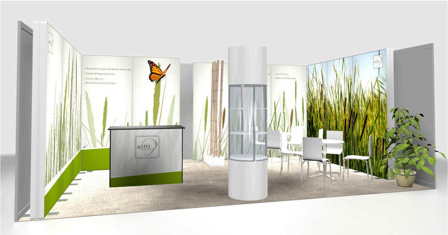
Messestand Gilli Hörberatung, 6x4 Meter