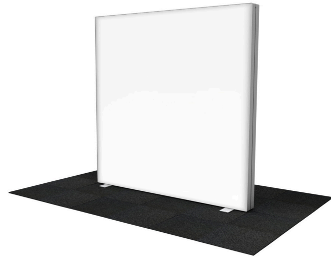
GO 200x225 cm