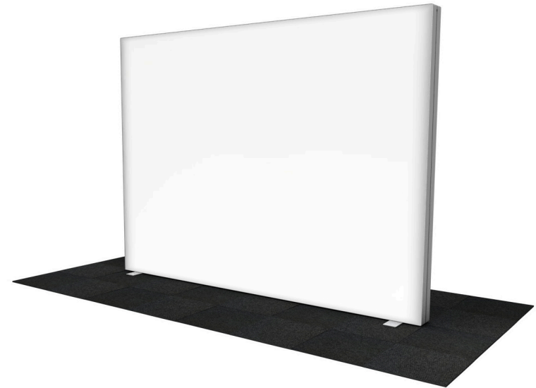
GO 300x250 cm