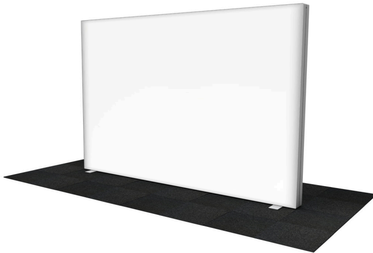
GO 300x225 cm