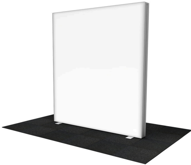
GO 200x250 cm