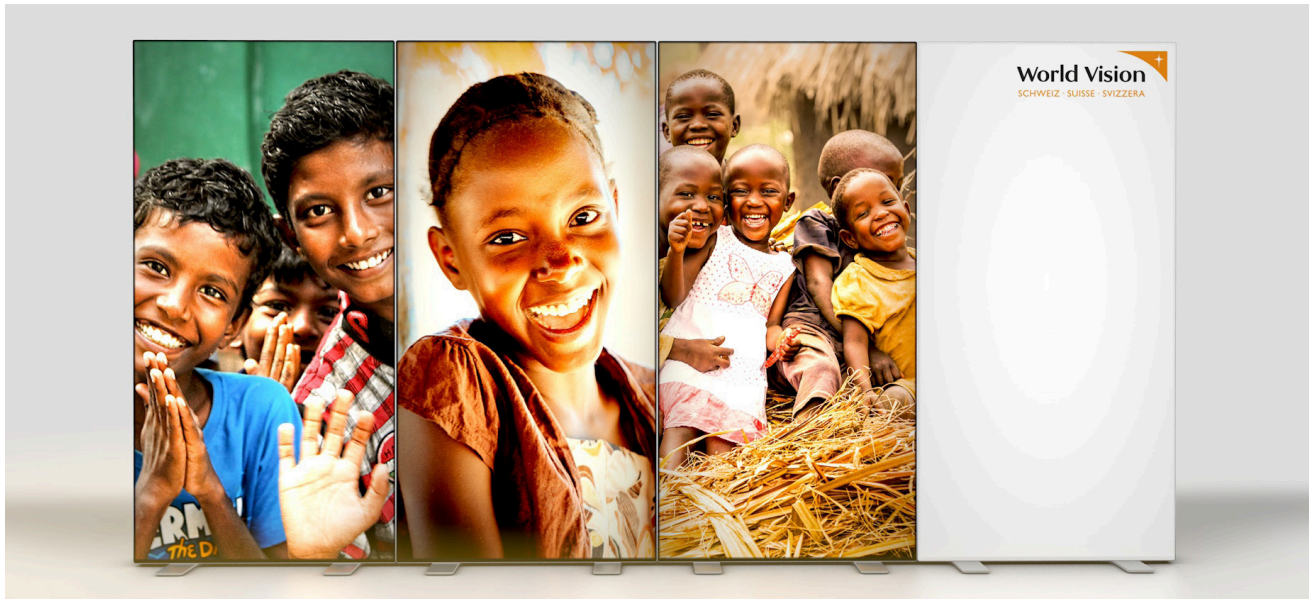
World Vision Sponsor-Kit