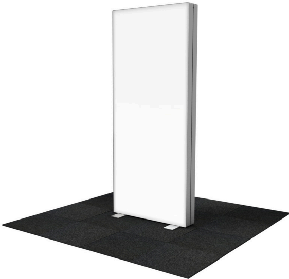
GO 85x225 cm