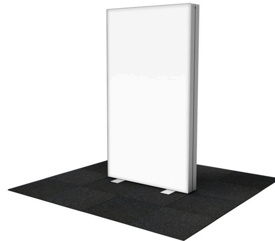
GO 100x200 cm