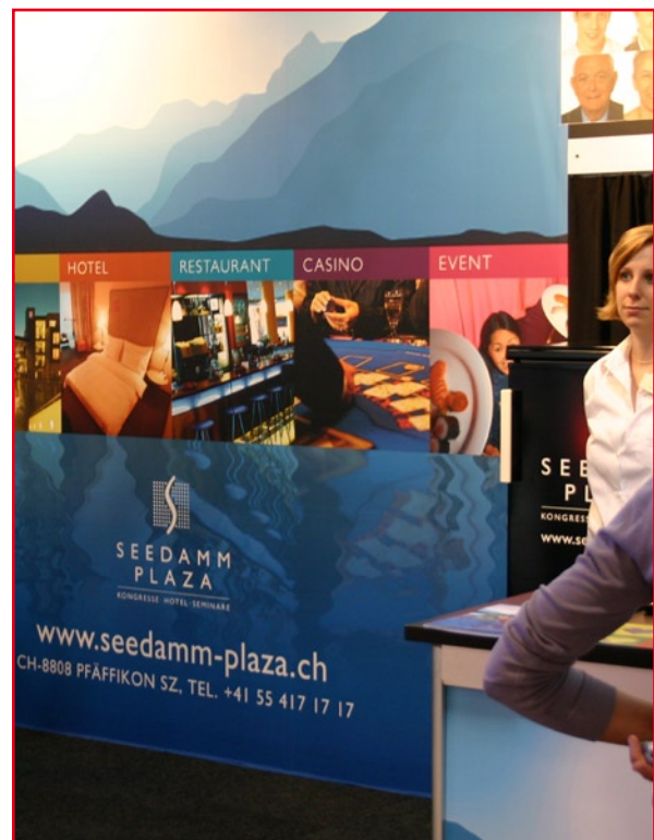
Bild: Wenn ein Besucher vor dem Display steht, sind wesentliche Informationen nicht mehr sichtbar!

„Die 60cm Zone mitten im oberen Teil des Displays ist die optimale Zone für Text“, sagt Adam Brodsley, Leiter der Volume Inc., eine Design-Firma in San Francisco, USA. „Es ist die eigentlich einzige Zone, die vom Besucher mitten in einer Menschenmenge optimal gelesen werden kann“. Wenn Sie nicht den ganzen Text in diese Zone bekommen, bleiben Sie zumindest auf Augenhöhe. Dies wäre auf einer Höhe von ca. 1.5 Metern.